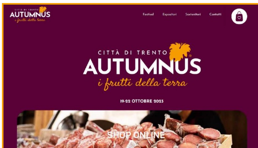
Foto: canale di vendita su www.autumnus.trento.it

L'anno scorso il sito ha accolto 57.000 visitatori nel periodo della manifestazione.